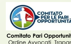
Comitato Pari Opportunità Ordine Avvocati Trapani