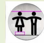
Comitato Pari Opportunità Ordine Avvocati Marsala