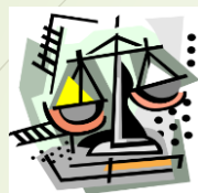
Comitato Pari Opportunità Ordine Avvocati Caltanissetta