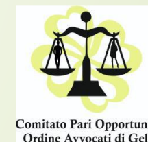
Comitato Pari Opportunità Ordine Avvocati di Gela